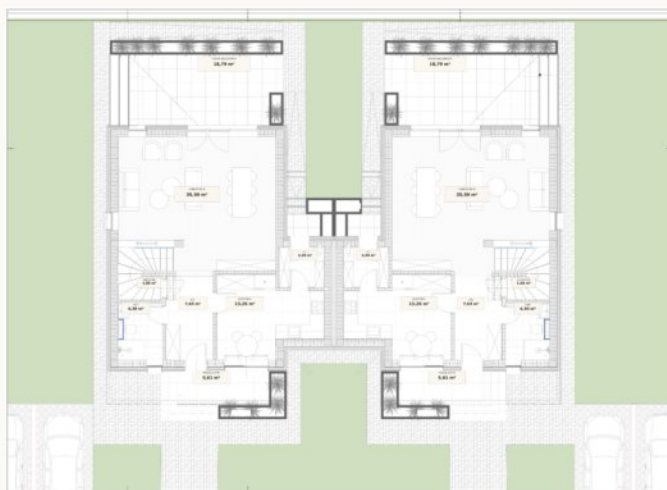
Cuplată · Etaj